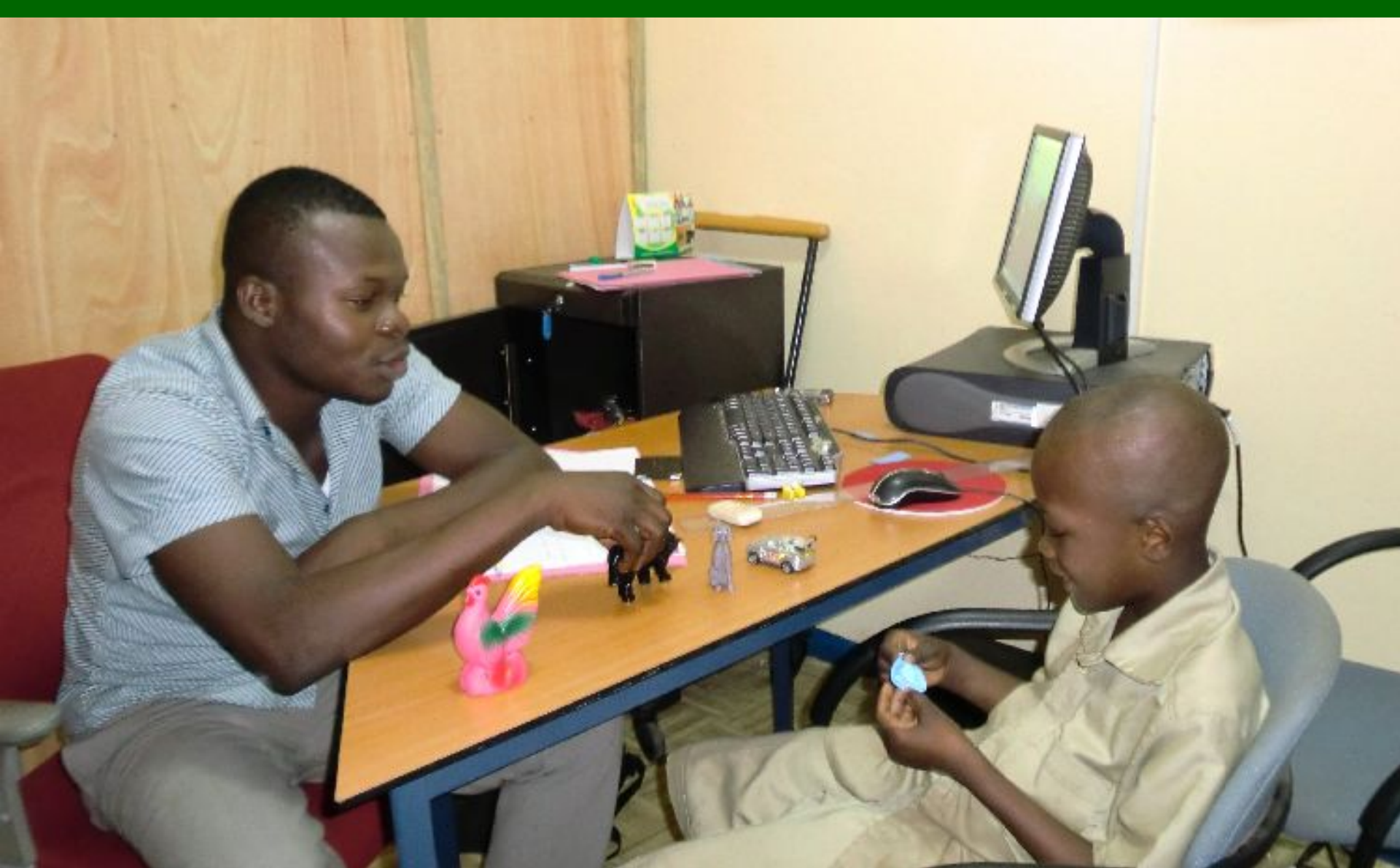
2 e logopedist behandelt jongen