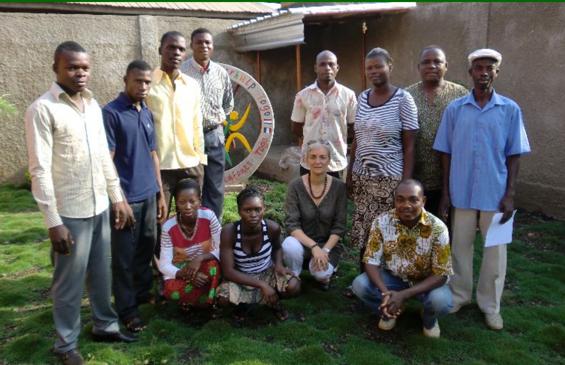
Het vaste team