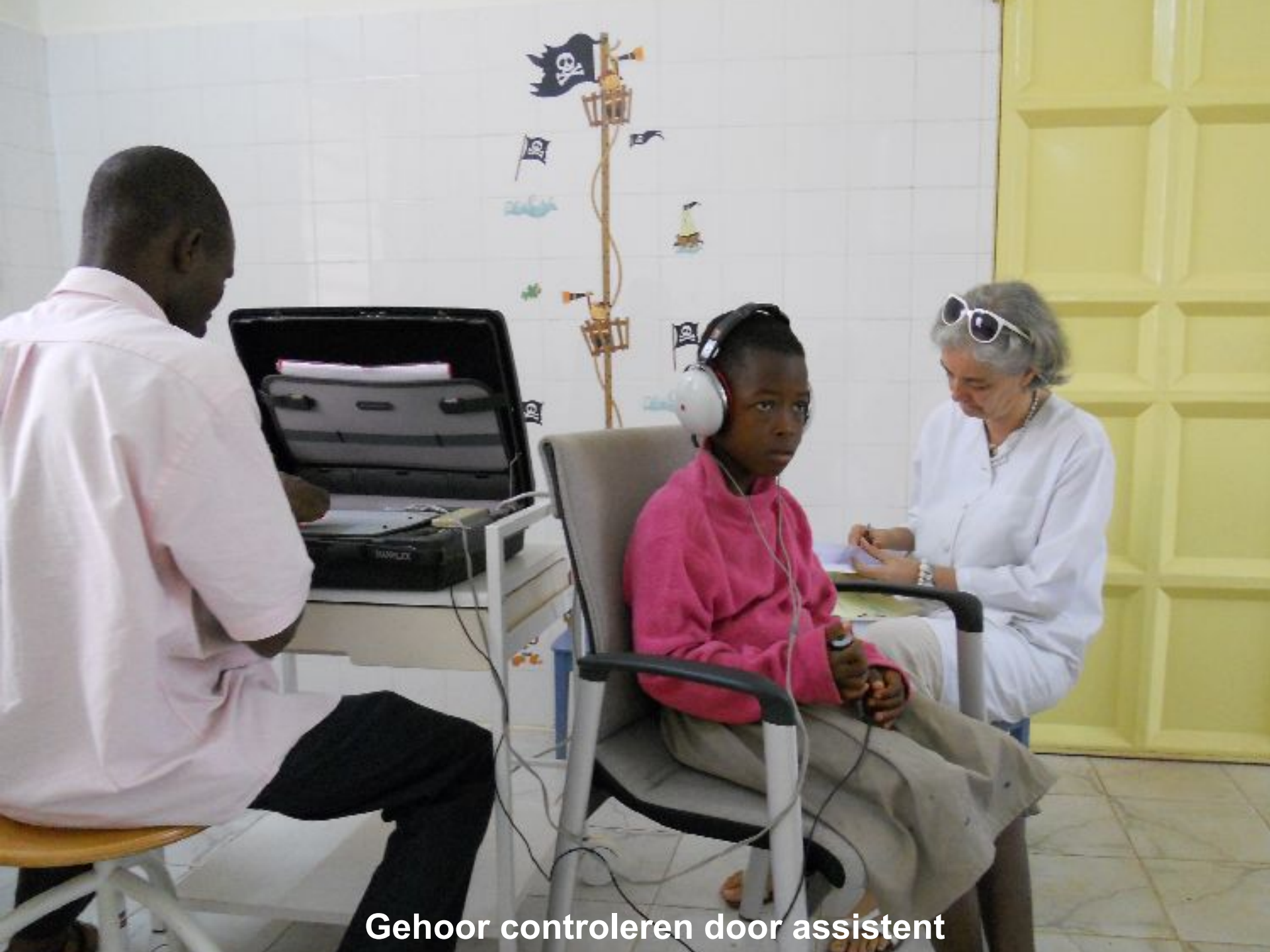
Gehoer controleren door assistent