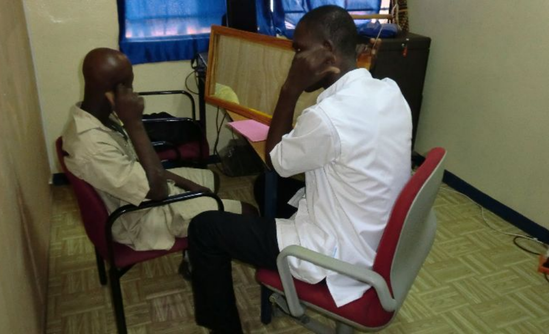
Logopedist behandelt jongen