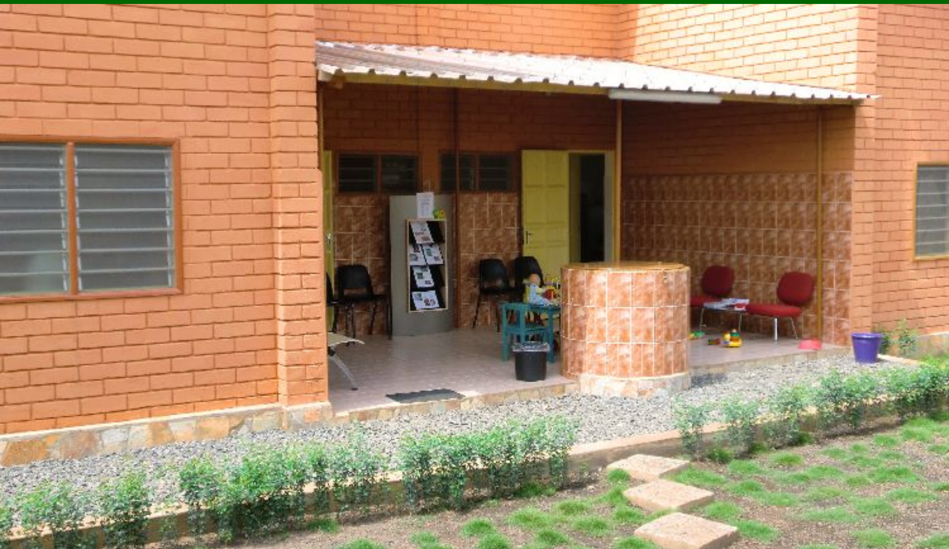
De wachtkamer leeg