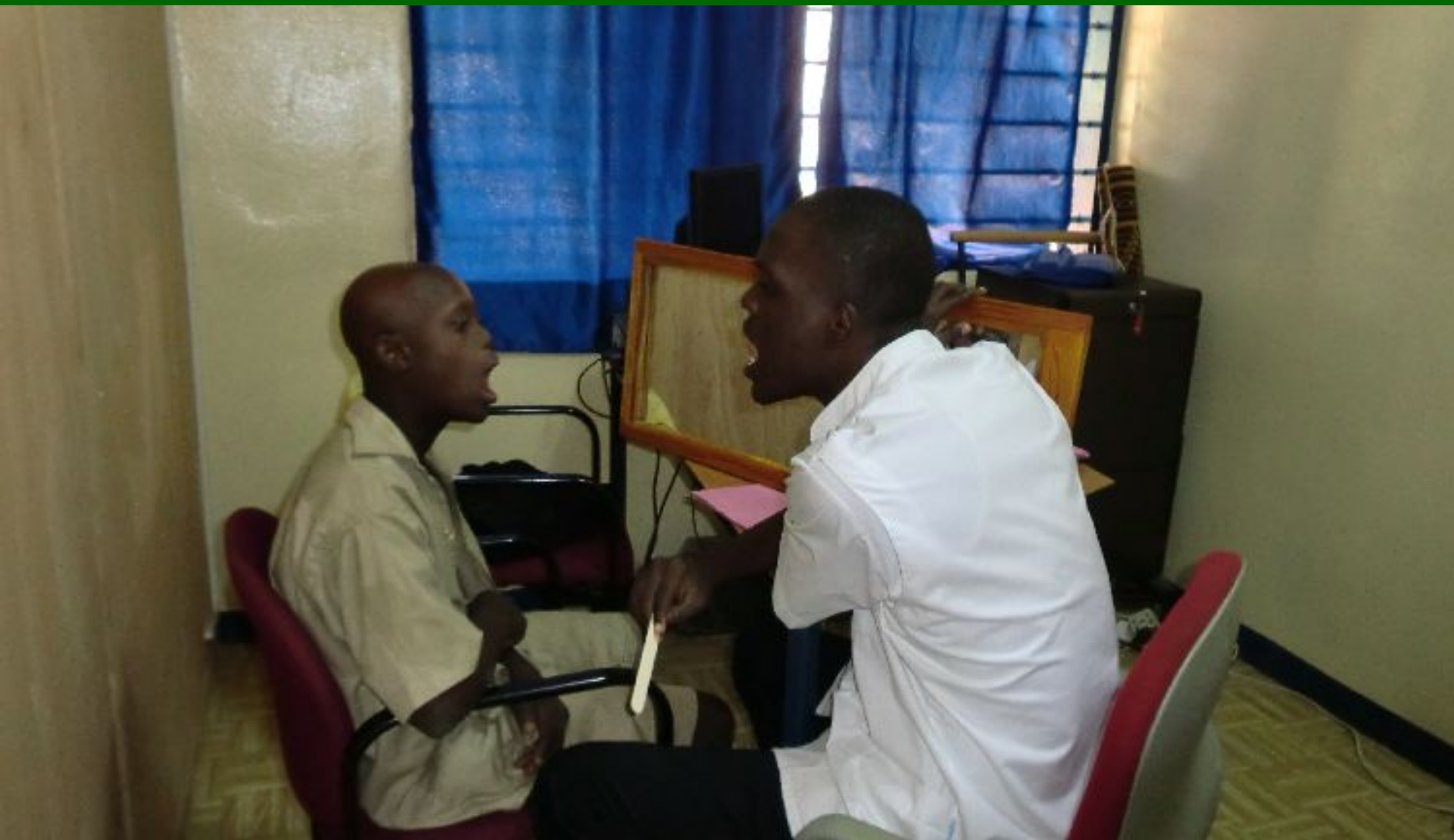
Logopedist behandelt jongen