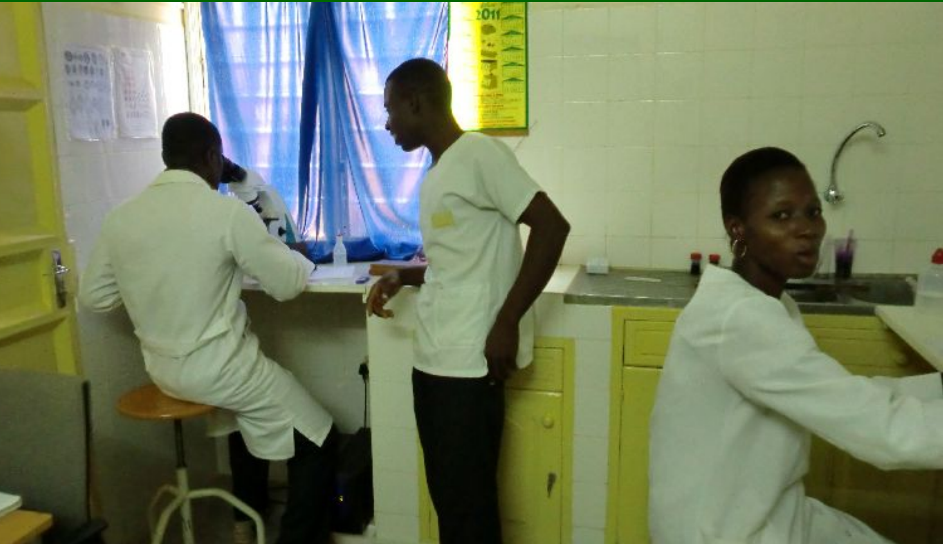
Onderzoek bloed en ontlasting in laboratorium