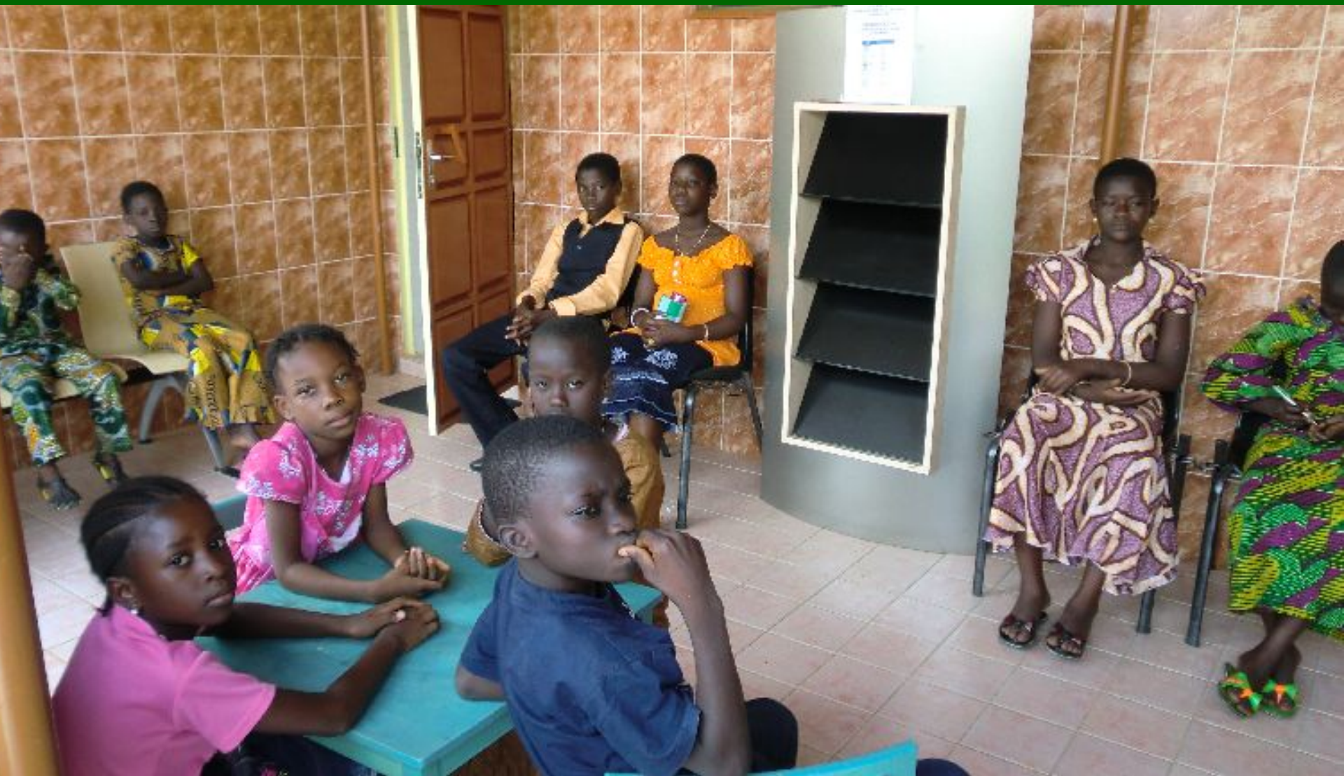
De wachtkamer vol