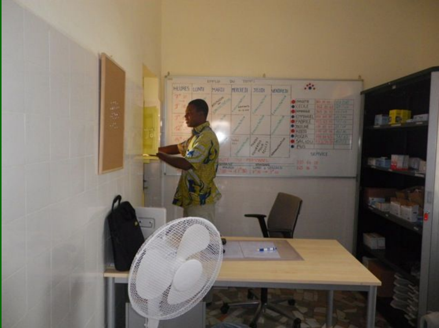
Administrateur geeft op recept van arts medicijnen uit