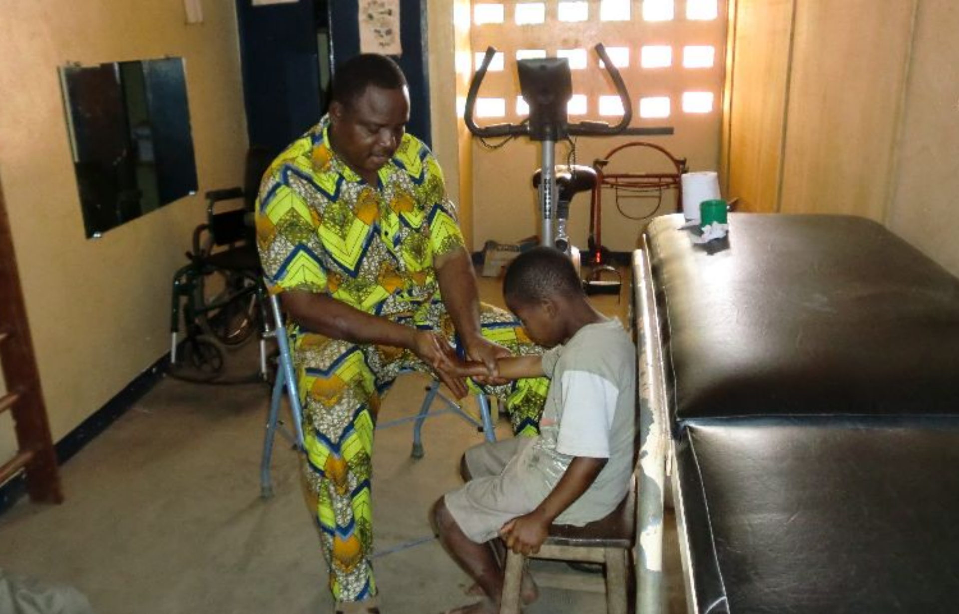
Fysiotherapeut behandelt kind